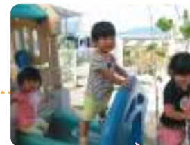
子供たちの笑顔を 応援します