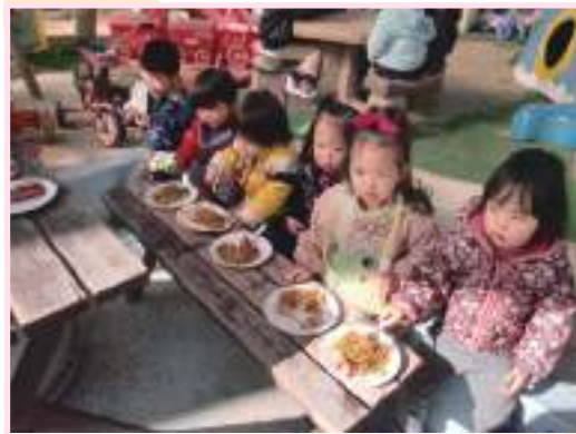
晴れた日はバーベキュー♪