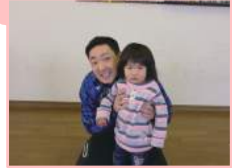
全日本女子バレーボールのコーチ2名が ひよこに遊びにきてくれました♪