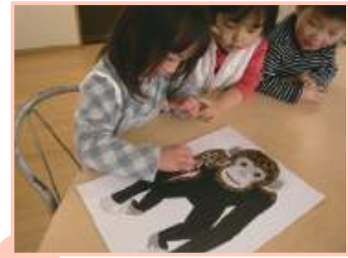
普段では見られない光景です。