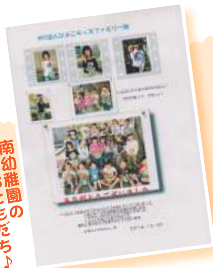
南幼稚園のおともだち♪