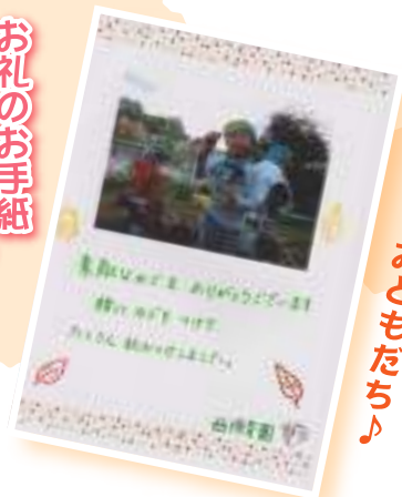
西保育園のおともだち♪