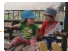
子供たちの笑顔を 応援します