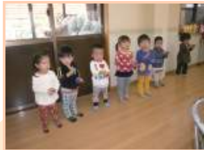
2才児、毎日の練習頑張っています。